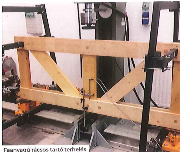
Faanyagú rácsos tartó terhelés

„A természet erőforrásait az emberiség kedvére és hasznára fordítja.”