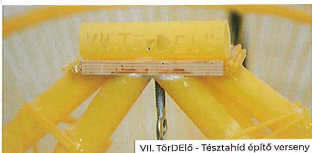
VII. TörDELő - Tésztahíd építő verseny