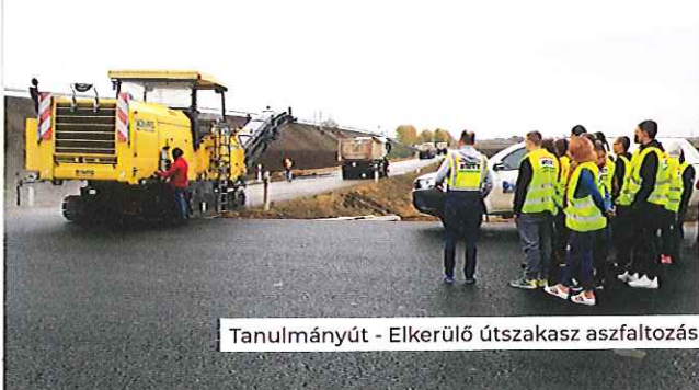
Tanulmányút - Elkerülő útszakasz aszfaltozás